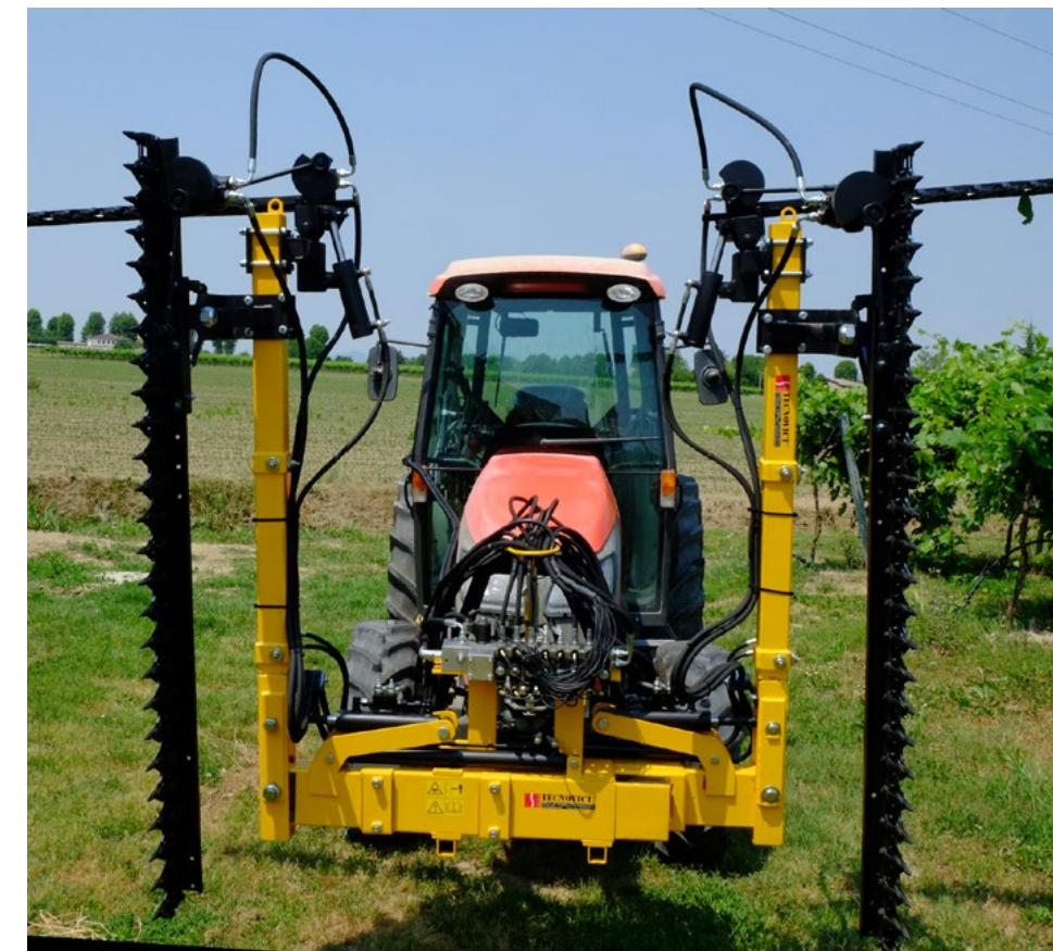
Erhältliche Modelle für Weinberge