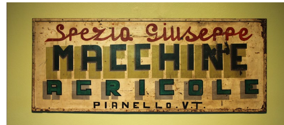
Historisches Firmenschild vom 1949